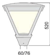
Размеры для монтажа