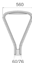
Размеры для монтажа